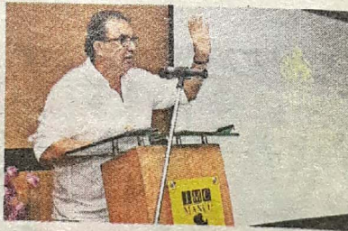
మాట్లాడుతున్న దర్శకులు శివేంద్రసింగ్

మాదాపూర్, న్యూస్ టుడే: దేశ వారసత్వ సంస్కృతిలో భారతీయ సినిమాలు భాగమేనని, వాటిని పరిరక్షించుకోవాల్సిన అవసరముందని ప్రముఖ సినీ దర్శకులు శివేంద్రసింగ్ దుంగార్పూర్ అన్నారు. సినిమా రంగాన్ని నిర్లక్ష్యం చేయడం సరికా